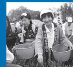
5月1日市役所前で開かれた新茶まつりにて

農林部は「本庁と出先あわせて11人増強した」「他の農林総合研究センター研究所全体から人を派遣して相談に対応した」と答弁。私は「他の研究所から人を派遣するのは、またそこが手薄になる」として、農林部職員を増員して配置すべきだと指摘しました。