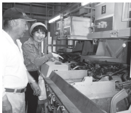
5月13日 所沢市内の荒茶工場にて

新茶の時期を前に県は、国の要項を超える全荒茶工場の放射能検査を行い、基準値以下であることが確認されました。引き続き検査は続けられます。安心して狭山茶を飲んで下さい。