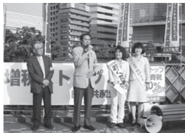
川口駅で消費税ストップを訴えました

民主党、自民党、公明党の合意によって、消費税の10%増税・社会保障の改悪などを含む各法案が衆議院で可決されました。段階的に消費税を2015年までに10%に引き上げる暴挙は許されません。私は、消費税に頼らなくても社会保障は充実できますと皆さんに訴え続けています。参議院でなんとしても増税をストップさせましょう。