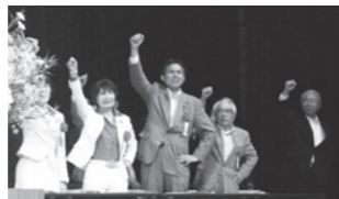
「関東ブロック子ども・子育て新システムを考える1000人研修会」(埼玉会館)に参加しました。